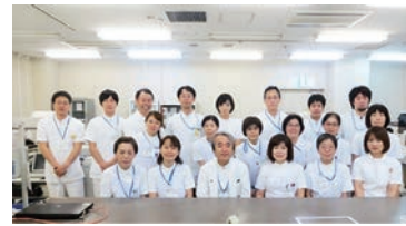
診断の助けになるように制度の高い検査を提供し、一丸となり業務に取り組んでいます。

当院の放射線科は、質の高い検査を提供し精度の高い診断になるよう努め日々進歩する医療技術に対応しています。担当検査は放射線を使用する検査をはじめその他に、超音波検査・MRIも行っており、検査中に患者さんの負担や苦痛を減らせるように工夫しています。検査で分からない事、不安等がございましたらご相談ください。